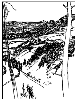
Das alte Wehrda vom Weißen Stein aus.

1985 begannen wieder einmal Ausgrabungen, nachdem bereits 1956/57 und 1885/86 Grabungen stattgefunden hatten und die alten Mauerreste wieder zugeschüttet wurden. Mit den letzten