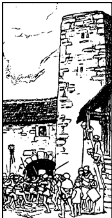
Die Eroberung der Burg Weißenstein, wie sie Ubbelohde gezeichnet hat.

hinab in die Lahn. Alle sieben Jahre steigt das Rad vom Grunde empor, und wer dann Glück hat, kann es sehen und herausziehen. Die Grundmauern der Burg auf der Kuppe sind zurzeit von Erdreich entblößt. Aber schon immer konnte man am steilen Hang über der Lahn die mächtigen Mauerreste bewundern. Nach der Sage sollen die Wehrdaer Bauern die Burg zerstört haben und Otto Ubbelohde lässt in seiner künstlerischen Freiheit die Wehrdaer Bauern die